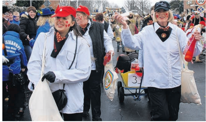
Können und wollen den Ursprung ihres Namens nicht leugnen, wie man sieht: die Kaiserlichen.

Da wir ein wild zusammengewürfelter Haufen sind, passt unser Motto dieses Jahr perfekt: DIE KAISERLICHEN JANZ JECK. Wir hoffen, dass uns die Anrather an Tulpensonntag dabei unterstützen, JANZ JECK zu sein. Die Kaiserlichen