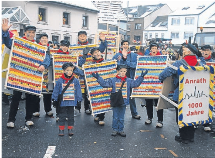
Die Anroethsche Pappköpp nahmen im vergangenen Jahr als Webergruppe an dem Tulpensonntagszug teil.