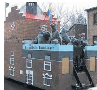
Der Freundeskreis.

Der Anrather Freundeskreis freut sich wieder auf die vielen Besucher am Straßenrand, auch wenn ein kleiner Wehmuts-tropfen in der Luft hängt: Der Tulpensonntagszug wird das erste Mal nicht mehr durch die Fußgängerzone ziehen. Sie sind