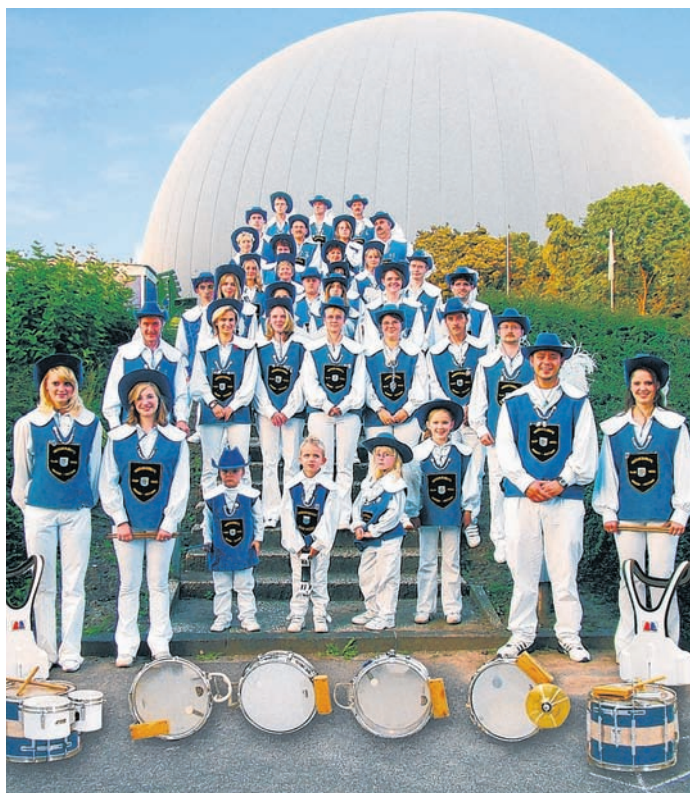
Das Musikkorps Blau-Weiß Bochum.