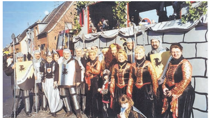
Die „Schwaadlappen“ ziehen seit 2004 mit.

Flotte Truppe von karnevalsbegeisterten Willicher Eltern und Kindern.