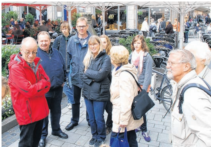
Die Sommerfahrt der Karnevalisten führte nach Köln.

Stadtführung unter dem Motto „Kölle Alaaf“