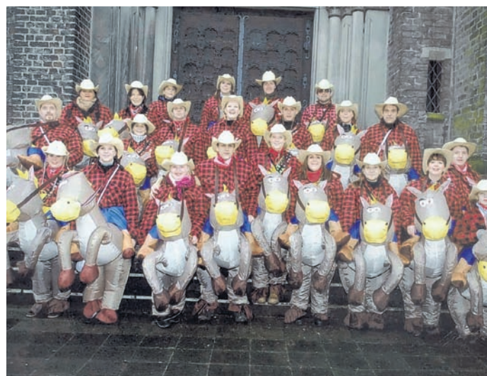
Die Doesköpp, beim letzten Jahr als Cowboys unterwegs, bringen den lachenden Clown nach Anrath.