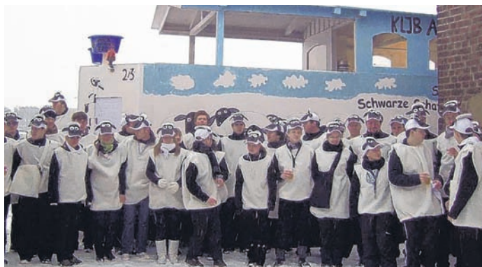
Der Wolf im Schafspelz? Wer weiß? Im letzten Jahr sind die Mitglieder der KLJB als Schafherde mitgezogen – in diesem Jahr erleben wir sie als „Highlandjugend“.

Das wird uns allerdings nicht dazu bringen, auf Karneval zu verzichten, denn wir fiebern schon jetzt dem närrischen Wochenende entgegen!