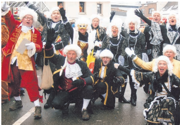
Die Saunafreunde im Tulpensonntagszug 2010.

närrischen Tage im März werden den Zuschauern, Veranstaltern und Zuginsassen voraussichtlich trockenes Wetter und wärmende Sonnenstrahlen bescheren. Und was wird dann aus dem Motto der Saunafreunde? Für diesen Fall könnte eine andere Auslegung in Betracht gezogen werden: „Anrötsche Eiszeit“ unter wirtschaftlichem Aspekt. Eiszeit beim Anrather Einzelhandel? Vielleicht ist das Saunamotto eigentlich ein Appell Richtung Kommunalpolitik? Das allerdings würde bedeuten, dass sich die auffällige Fußtruppe nach 16 Jahren erstmalig ernsthaft mit ihrem Thema und der Kostümwahl auseinandergesetzt hätte.