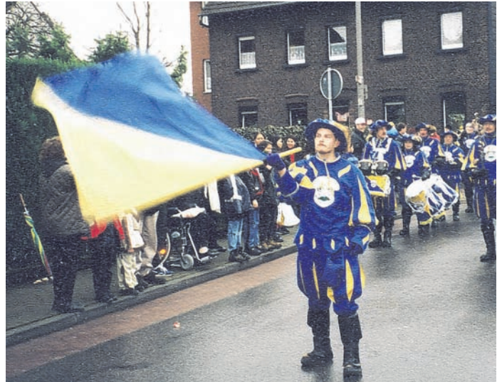
Der Landsknechtanzug Bochum.