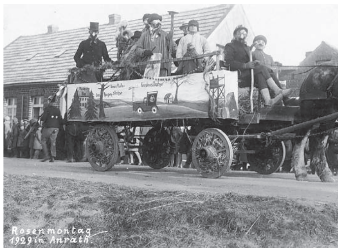
Schon 1929 fand in Anrath ein Karnevalszug statt.

Weitere Informationen gibt es auch im Internet: www.aach-blenge.de