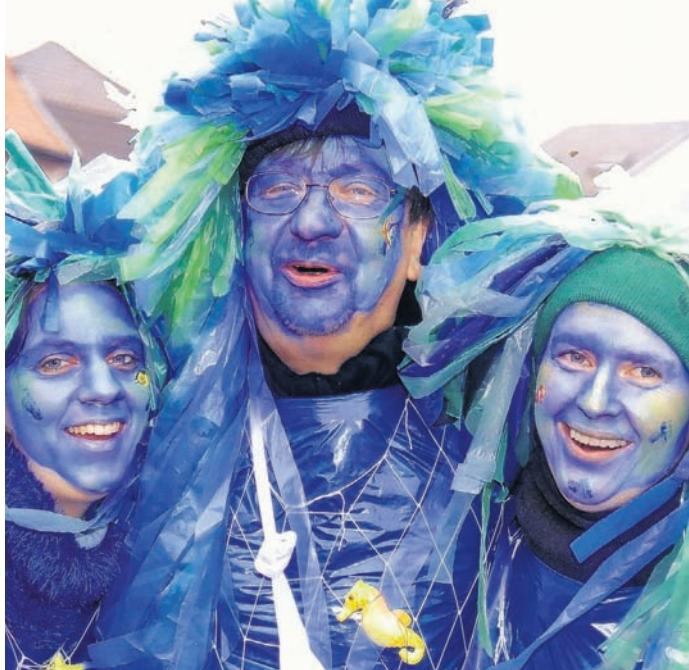
Kennen keine Scheu vor Karnevalsschminke und närrischen Utensilien: Die Jucken der KG Edelweiss.

Willicher Karnevalisten wollen das Publikum mit Spezialitäten verwöhnen.