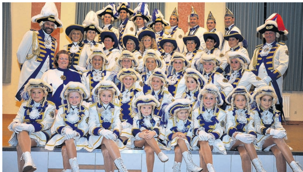
Die Prinzengarde der Stadt Willich.

Die Willicher Prinzengarde war auch in dieser Session als Willicher Botschafter weit über die Stadtgrenzen hinaus ein gern gesehener Gast. Bei über 100 Auftritten in Willich, Brüg-